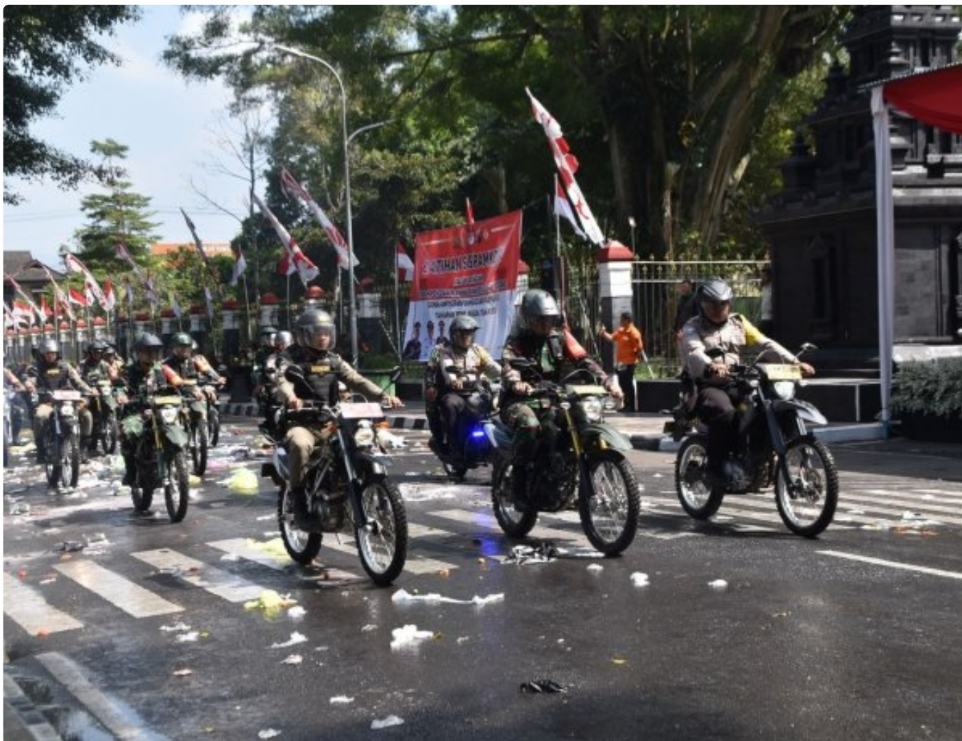
Foto: Kegiatan Kodim 0707/Wonosobo bersama Polres Wonosobo mengadakan latihan bersama Sistem Pengamanan Kota (Sispamkota) di Alun-alun Wonosobo, Jawa Tengah, Rabu (21/08/2024).